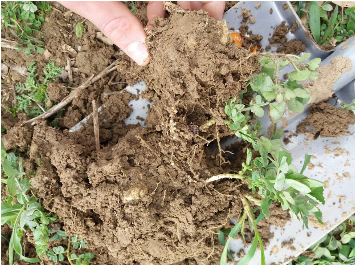
Foto 1: Beurteilung der Bodenstruktur und Knöllchenbesatz bei Leguminosen

Im Frühjahr finden Arbeitskreistreffen auf den Feldern von Mitgliedsbetrieben statt. Die Teilnehmer beurteilen mittels Spatendiagnose die Bodenstruktur, die Aktivität der Bodenlebewesen, aber auch die Wurzelentwicklung der Kulturen. Bei Leguminosen wird der Knöllchenbesatz überprüft, um Rückschlüsse auf die Stickstoff-fixierungsleistung ziehen zu können.