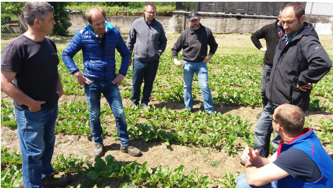
Foto 1 und 2: Arbeitskreisteilnehmer auf Zuckerrübenfeldern in Drassburg